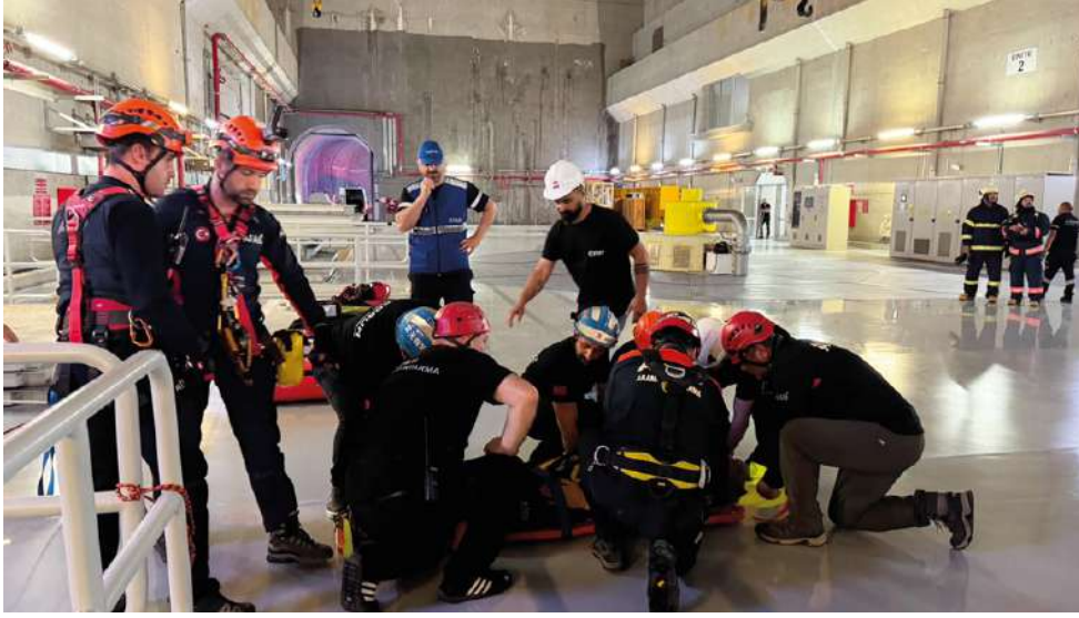
Yangına itfaiye ekipleri müdahale ederken,

Senaryo gereği meydana gelen trafo patlaması ve yangın sonrası türbin bölümünde mahsur kalan personel, ekiplerin koordineli çalışmasıyla başarıyla kurtarıldı. Artvin-Yusufeli kara yolunun 40. kilometresinde bulunan Artvin Barajı'nda düzenlenen tatbikatta, yüksek gerilim hattında meydana gelen arıza nedeniyle trafolarda patlama ve ardından yangın çıktığı senaryosu uygulandı.