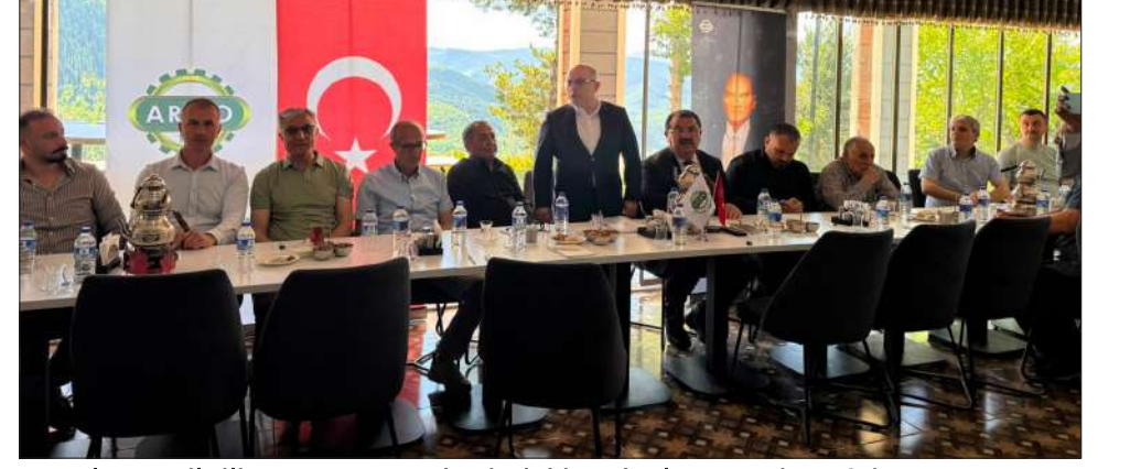
sorunlarının ilgili paydaşlarla birlikte değerlendirilmesinin çözüm sürecine önemli katkılar sağlayacağını söyledi. Toplantıda Şavşat'ın öncelikli sorunları ve gelişim alanları ele alındı. Özellikle ulaşım ve yol sorunları, ilçe