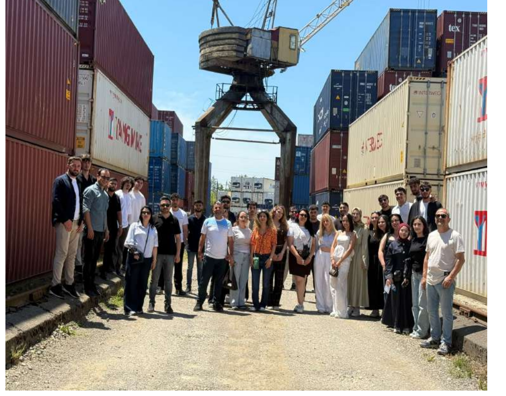
Hopa Ticaret ve Sanayi Odası Meclis Üyesi ve Hopa MYO-Hopa TSO İş Birliği Yürütme