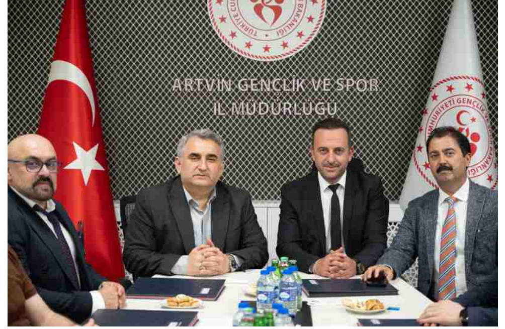
Bir yıl süreyle geçerli olacak protokol