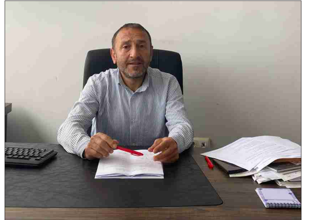
Çay üreticilerini yok sayanları da biz çay

ihanedir, çiftçiye ihanedir. Biz çay üreticileri ve ziraat odaları olarak diyoruz ki çay üreticilerinin alın terinin karşılığı 41 liradır. 41 liranın altında fiyat belirlemek, patronların avuçlarına para doldurmak demektir. Patronların kazanması demektir. Özel sektörün kazanması demektir. Özel sektör kazanacak, çay üreticileri kaybedecek. Rize Ticaret Borsası'nın belirlemiş olduğu fiyatı kabul etmiyoruz. Bu fiyat ihanet fiyatıdır diyoruz.