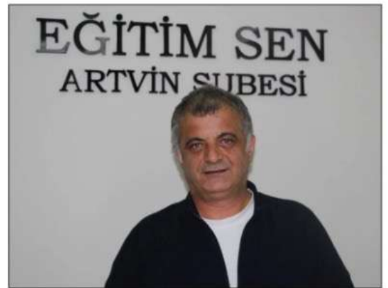
hiçbirimiz!" ifadelerini kullandı.

bir kampüs ortamında eğitim hakkını savunmak adına hizmet üretmeme kararı alınmıştır" dedi. Ancak, sendikaların bu karar alınmasından sonra, İstanbul Cumhuriyet Başsavcılığı tarafından "suç işlemeye alenen tahrik" iddiasıyla sendika hakkında soruşturma başlatıldı. Eğitim Sen, bu soruşturmanın sendikal faaliyetlere yönelik hukuksuz bir müdahale olduğunu vurgulayarak, "Bu soruşturma hukuki dayanaktan yoksundur ve gerçekleri çarpıtan bir tutumdur. Kabul edilemez!" açıklamasında bulundu. Sendika, demokratik haklarına yönelik bu tür baskıların kabul edilemeyeceğini vurgulayarak, "Eğitim emekçilerinin dayanışması ve kamuoyunun desteği ile bu baskıları aşacağız. Kurtuluş yok tek başına, ya hep beraber ya