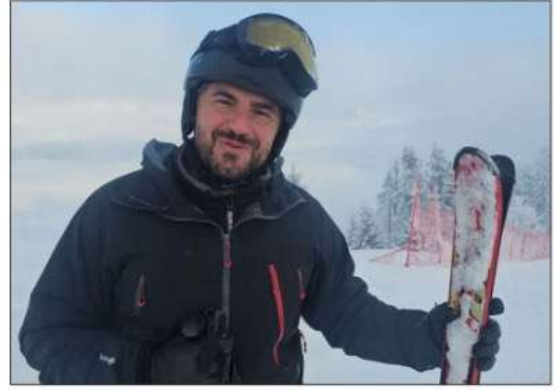
duyulduğunu belirten Çelik, "Herkesi buraya davet ediyorum. Bu inanılmaz manzaranın hepsini herkes yaşasın isterim" ifadelerine yer verdi. Malvina BIBİLASHVİLİ

çıkartıyoruz. Tabii ki karımız doğal, Erzurum gibi yapay üretmek zorunda değiliz" şeklinde konuştu. Çelik, Atabarı Kayak Merkezi'nin sunduğu doğal manzaranın keyfini çıkarmanın eşsiz olduğunu vurgulayarak "Sanki dağda değilim ama Erzurum'da yükseğe çıktıkça basınç azaldığı için nefes sıkıntısı yaşayabiliyorsunuz. Sanki dağda değilim ama çok yoğun kalamadık. Burası o kadar yoğun değil ve orman içinde kalmak, doğanın içinde kaymak inanılmaz bir keyif" dedi. Kayak merkezinin gelişmesi ve ayakta durabilmesi için daha fazla ziyaretçiye ihtiyaç