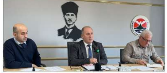
sonunda tüm üyelere katılımından dolayı teşekkür ederek, kabul edilen kararları

Araç Hibe Talebi Arhavi Millî Eğitim Müdürlüğü tarafından belediyeden istenilen araç hibe talebi de gündemde yer aldı. Bu talep, eğitim kurumlarının ihtiyaçlarının karşılanması amacıyla değerlendirilerek oy birliği ile onaylandı. Toplantı, halkın katılımına açık olarak gerçekleşti ve belediye hizmetlerinin daha verimli yürütülmesi adına önemli adımlar atıldı. Belediye Başkanı, toplantı