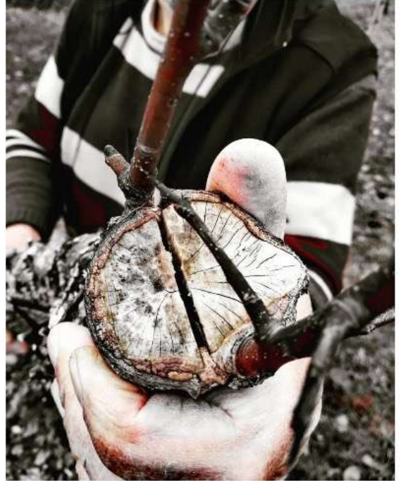
şey görmek, bir ses duymak istiyordum" ** ERDAL DEMİR/ EYLÜL 2024

*** "Ağır ağır ilerleyen akşamın ayak seslerini duyuyor gibiydim, derken bir ürperdi hissettim. Sanki devran durmuş, haftalardan beri gölgelerinde dolaştığım o limon yeşili kayın ormanları karanlık sütunlar galerisini andıran ladin ormanları, o kıvrak dereleri süsleyen gök yeşil meşelikler, mor dağ güllerinin bürüdüğü yamaçlar, her şey, kâinat yok olmuş bir ben kalmışım...Sessiz karanlığa gözlerimi dikmişim. Yürüyen, kımlıdayan canlı bir