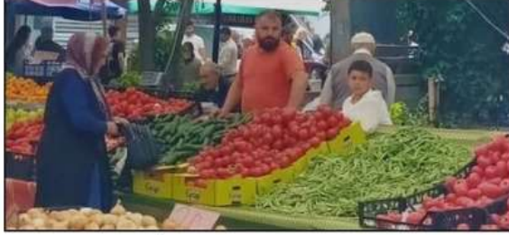
arşısı dikkat çekti. Öte yandan, karpuz ve kavun gibi yaz meyvelerinde indirimler yaşandı. Sebze bölümünde, patates ve

Her hafta pazartesi günleri kurulan semt pazarında bu hafta sebze ve meyve fiyatlarında dalgalanmalar yaşandı. Bazı ürünlerin fiyatlarında artış gözlenirken, birçok üründe ise fiyatlar düştü. Sebze ve meyve alışverişlerini yapmak isteyen vatandaşlar, pazanın yolunu tuttu. Özellikle mevsimsel ürünlerde fiyat indirimleri görüldü. Patates ve soğan gibi temel sebzelerin fiyatları sabit kalırken, domates ve salatalık gibi ürünlerde fiyat