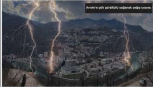
Artvin'e gök gürültülü sağanak yağış uyarısı

Artvin'de geçtiğimiz hafta etkili olan sıcak hava bugün yerini yağmura bıraktı. Meteoroloji Genel Müdürlüğü, Artvin'in özellikle iç kesimlerinde gök gürültülü sağanak yağışı uyarısı yaptı. Meteoroloji Genel Müdürlüğü tarafından yapılan son değerlendirmelere göre, bugün Doğu Karadeniz'in iç kesimlerinde gök gürültülü sağanak yağış bekleniyor. Öğle saatlerinde itibaren etkisini artırarak aralıklı ve yerel olarak başlayacak olan yağmurun kuvvetli olacağı tahmin ediliyor. Gece saatlerine kadar devam etmesi ön görülen yağışlara karşı Artvin Valiliği vatandaşlara uyarılarda bulundu.