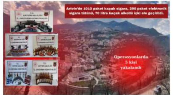
Artvin'de 1010 paket kaçak sigara, 290 paket elektronik sigara tütününü, 70 litre kaçak alkollü içki ele geçirildi.

Artvin Valisi Cengiz Ünsal konuya ilişkin yaptığı açıklamada, "Halkımızın güvenliği için kaçakçılık ve organize suçlarla mücadele kapsamında çalışmalara kararlılıkla devam