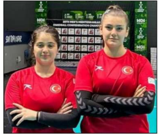
devamı, ildeki spor kültürünün güçlenmesi