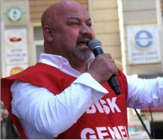
Artvin'de, 1 Mayıs Emek ve Dayanışma Günü dolayısıyla kutlama