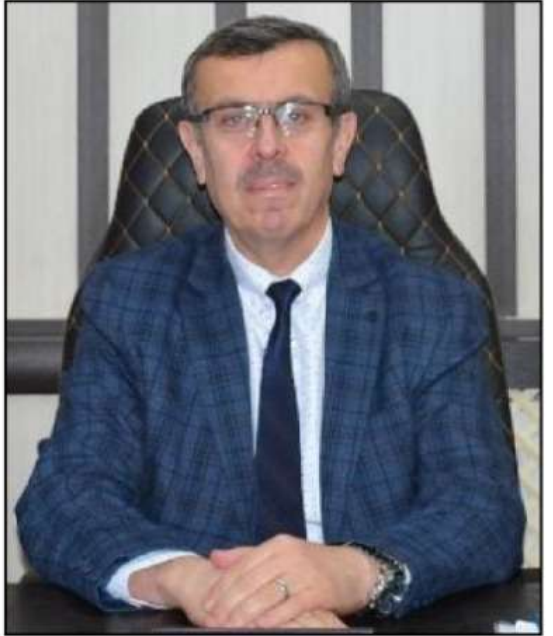
şekillendirmenin gayrefinde olalım. Olalım ki, ahiretimiz de bayram olsun akibetimiz de bayram olsun. Bu duygu ve düşüncelerle, başta Artvinli hemşehrilerimiz ve milletimiz olmak üzere tüm İslam âleminin Ramazan bayramlarını tebrik ediyor,

En önemlisi de, Ramazan'da elde ettiğimiz bütün kazanımlarımızı ve güzelliklerimizi Ramazan sonrasına da taşıyarak bu konudaki istikrarımızı koruyalım. Hayatımızın tüm anını Ramazan gibi