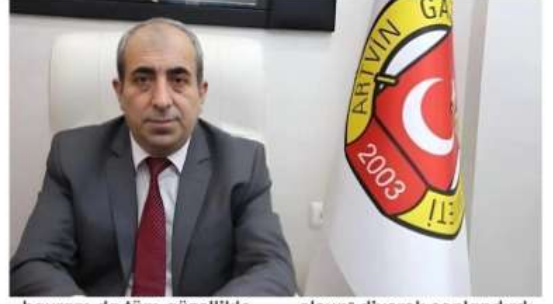
bayram da tüm güzellikle-riyle gelsin, gönüller bir

Bayramın, özellikle çocuklar başta olmak üzere herkese mutluluk getirmesini dileyen Alkan, mesajını "Bayramlar, bir araya gelmenin, dayanışmanın ve paylaşmanın simgesidir. Bu