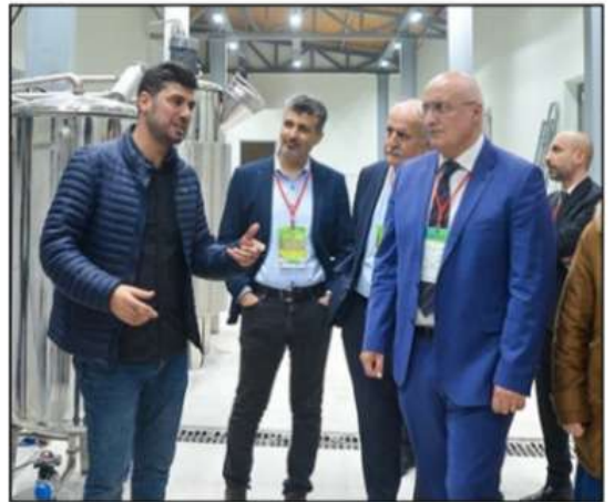
Bunun yanı sıra elde edilen ürünlerin sağlık ve kozmetik sektörleri ile diğer endüstrilerde kullanılmasıyla bölgedeki istihdam artacak sosyo-ekonomik açıdan da olumlu çıktılar elde edilebilecektir. Sonuç olarak Tıbbi-Aromatik Bitkiler

haline dönüştürülerek gıda ve ilaç sektöründe kullanılmak üzere paketlenip satışa konu edilmesi sağlanacaktır. Bu tesisin Artvin Çoruh Üniversitesine sağlayacağı katkı ve katma değer çok yüksektir. Üniversitemiz tesis bünyesinde yürütülecek çalışmalarda doğal kaynaklardan elde edilen ve üretimi gerçekleştirilen tıbbi ve aromatik bitkileri etkin bir şekilde işleyerek değerli bileşenlerin elde edilmesine olanak sağlayacak ve bunların endüstriyel kullanımına katkıda bulunacaktır. Ayrıca tıbbi ve aromatik bitkiler sahasında hâlihazırda uygulamaya konulan projelerin tamamlanmasıyla tesis Üniversitemizde araştırma ve geliştirme faaliyetlerini destekleyecek, akademik alanda bilimsel çalışmalara yeni alanlar sunacaktır.