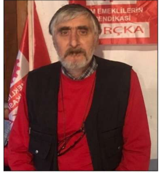
19 Mart günü saat 14.00 te Belediye önünde gerçekleştirileceğimiz basın açıklama-