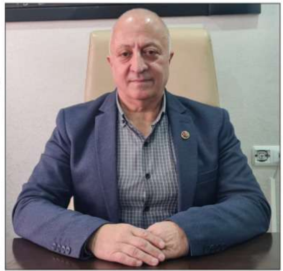
hemşerilerimin vereceği değerli oylarla sizlere hizmet etmekten gurur duyacağım. 2022 Yılında Artvin Belediye-

iyi ilişkiler kurmaya çalışarak Çarşı Mahallesi hizmet sağlamaya çalıştım. Bunda bu güne kadar Artvin Belediyesindeki sorumluluk alanımdaki aldığım görevler ve tecrübelerin büyük katkısı olmuştur. Geçen beş yılda edindiğim tecrübe ve sizlerle kurduğum samimi ilişkiler sayesinde 31 Mart 2024 yerel seçimlerinde mahalleme her zaman her konuda hizmet etmek için yanınızdayım. Dünü yıllarla birleştirmek hizmetleri çoğaltmak için yeniden çarşı mahallesi muhtarlığına aday olduğumu buradan ilan ederek tecrübe kazanışın temennisiyle siz değerli