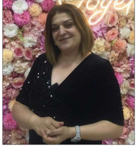
dağıtıldı. Salonu dolduran kadınlar gönüllerince eğlendi. Borçka yöresine ait oyun