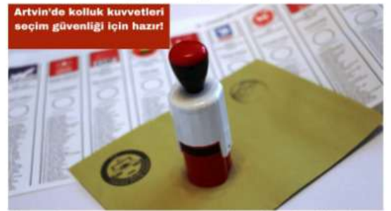
Artvin’de kolluk kuvvetleri seçim güvenliği için hazır!

İlimiz genelinde; 447 sandık alanındaki 658 sandıkta, 135 bin 225 seçmenin güvenli şekilde oy kullanabilmesi için İl Jandarma Komutanlığımız, İl Emniyet Müdürlüğümüz ve Sahil Güvenlik Komutanlığımızca gerekli güvenlik tedbirleri planlanmıştır.” dedi. 112 Acil Çağrı Merkezinin vatandaşların 7 gün 24 saat hizmetinde olduğuna vurgu yapan Ünsal; “Halkımızın huzurunu bozmaya teşebbüs eden her türlü duruma karşı ihbarlarınızı 112 Acil Çağrı Merkezimize bildirebilirsiniz.” diye