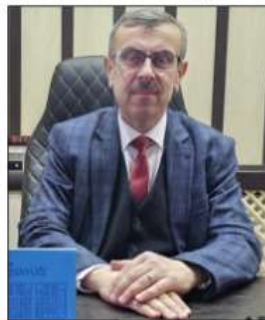
dayanışmanın ve sosyal yardımlaşmanın toplum hayatında yoğunluk