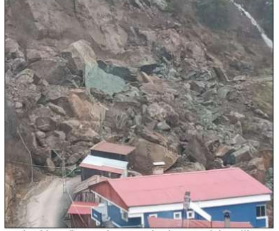
yolun bir an önce açılması için çalışmaların

Kaynarca köyü sakinlerinden Kerim Karagöz de