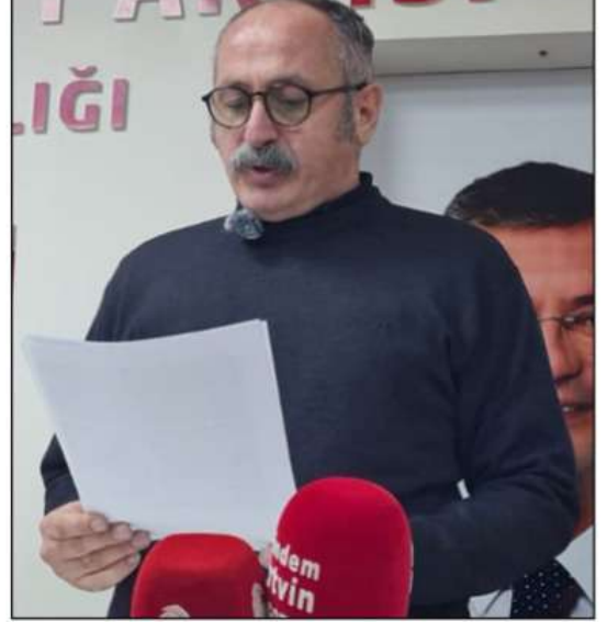
diliyoruz. Bütün deprem bölgesi yurttaşlarımızla dayanışma

konutlara halen geçilmemiş, yaşanan 1 yıllık süreç hamasetle geçirilmiştir. Bu gün depremin 1. Yıldönümünde siyasi iradenin en üstlerinden ölenlerin 130.000'ler düzeyinde olduğunu acıyla öğreniyoruz. Ölü sayıları üzerinden siyasi hesaplar yapanların kayıpların nerede olduğunu bilmesini de beklemiyoruz zaten. Yine depremde halkın yaralarının sarılması beklenirken ülkenin tek yöneticisi siyasi iktidarı yandaşı olmayan yerel yönetimlerin gerekli yardımı alamayacağını söylemek gaffinde bulunabiliyor. İnsanlığımızdan utanıyoruz. Bu duygularla ülkemizin yaşadığı en büyük doğal afetin 1. Yıldönümünde ölen yurttaşlarımızı bir kez daha anıyoruz. Yakınlarına ve ülkemize başsağlığı