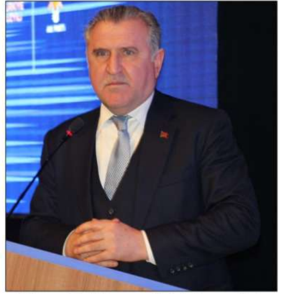
İttifakının gücünü tüm Türkiye’ye göstereceğiz. Belediyeleri Artvin’in tüm

Yüzyılında Türkiye Yüzyılına kabinesine olarak yoğun bir şekilde çalışmalara devam ediyoruz.” dedi. “Cumhuriyet İttifakının gücünü tüm Türkiye’ye göstereceğiz” 6 Şubat Depreminde hayatını kaybeden vatandaşlara Allah’tan rahmet dileyen Bak, “Cumhurbaşkanımızın öncülüğünde konutları teslim etmeye devam ediyoruz. Sahada yoğun bir çalışma var. Artvin’e de hizmetlere devam edeceğiz. Artvin’i turizm şehri yapmak için, geliştirmek için her türlü desteği vermeye hazırız. Dünya 5’ten büyüktür diyen bir cumhurbaşkanına sahibiz. Onla beraber yol yürümeye devam edeceğiz. İnşallah 31 Mart’ta tüm Türkiye’de AK Belediyeciliği Cumhuriyet