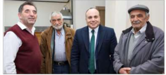
karşılımlarla geçen ziyaretlerde Vali Ünsal,

önemlidir. Yusufeli ilçemizde, bu süreci daha etkin bir şekilde yönetme noktasında, esnaf ve vatandaşlarımız ile iyi bir işbirliği içinde kurum ve kuruluşlarımız azami gayret göstermektedir. Esnaf ve vatandaşlarımızın görüşleri bu süreci daha etkin bir şekilde yönetmemiz için bize ışık tutuyor." dedi. Sıcak sohbet ve içten