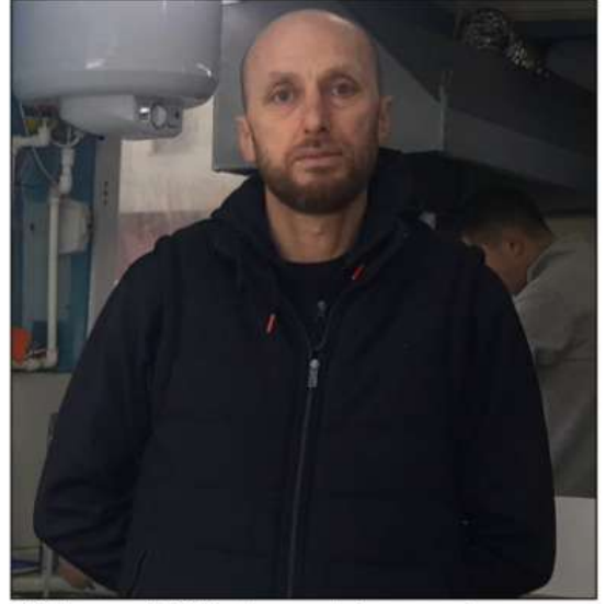
50 lira, mezgit 100 lira, hamsi çok pahalı 120 lira" ifade-

Balık tezgahında mezgit, istavrit, barbun hamsinin bulunduğunu söyleyen Karaşah, somon'un vatandaşlar tarafından tercih edildiğini belirtti. Kemalpaşa'da yerli halka satış yapamadıklarını vurgulayarak "Vatandaşlar fiyatları öğrenince çok tepki gösteriyor ama yapacak bir şey yok. Tepkilere göre talep var ama yan yana tabi. Yerli halka yan yana düşüştü. Alım gücü düşük. Gürcüye hitap ediyoruz masalanız Gürcü ile doluyor tezgahlarda öyle ama yerli halka fazla satış yapamıyoruz" "Çoğunlukla burada mezgit, istavrit, barbun, gırgırlardan da hamsi var. Bu ara somon çok satılıyor Gürcülere. Yerli halka fazla satamıyoruz genellikle Gürcüler alıyor. Şu an somon 150 lira, istavrit