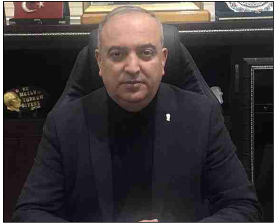
zamanda" ifadelerine yer verdi.

çalışmaları da bitmek üzere. Biten yerler var devam eden yerler var. Yol genişlemeleri yaptık birçok yerde duvar çalışmaları yaptık. Birçok yerleri güzelleştirdik ve halen daha devam ediyoruz. Birde meydan projemiz var yuvarlak alanımızı kaldırdık. Oraya daha güzel Borçka'ya yakışır bir şekilde daha güzel bir çalışma yapacağız. Bunları niçin yapıyoruz? Borçka için yapıyoruz. Bunun yanında bir kreş projemiz var İsmet Acar Sosyal Tesisleri'nde. Çocuklarımızın eğitimi, onların gelişimi açısından son derece olumlu bulduğumuz kreş çalışmamız var. Bu kreşi de kısa bir süre içerisinde faaliyete sokacağız. Durmadaan, yılmadaan elimizden geldiğince ekonomik koşullar dâhilinde çaba sarf ediyoruz. Aksu Mahallesinde Sayın Kaymakamımızın da girişimi ile bir kültür merkezi, bir kütüphane yapımına başlanacak yakın